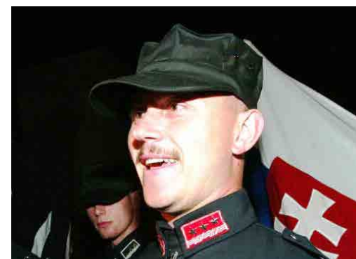
Лідер партії «Народна партія – наша Словаччина» – відвертий фашист Маріан Котлеба

Однак найбільш помітною особливістю співпраці Кремля та словацьких праворадикальних парамілітарних угруповань є активний рекрутинг місцевих «пасіонаріїв» для подальшого залучення до терористичної діяльності на Донбасі у складі