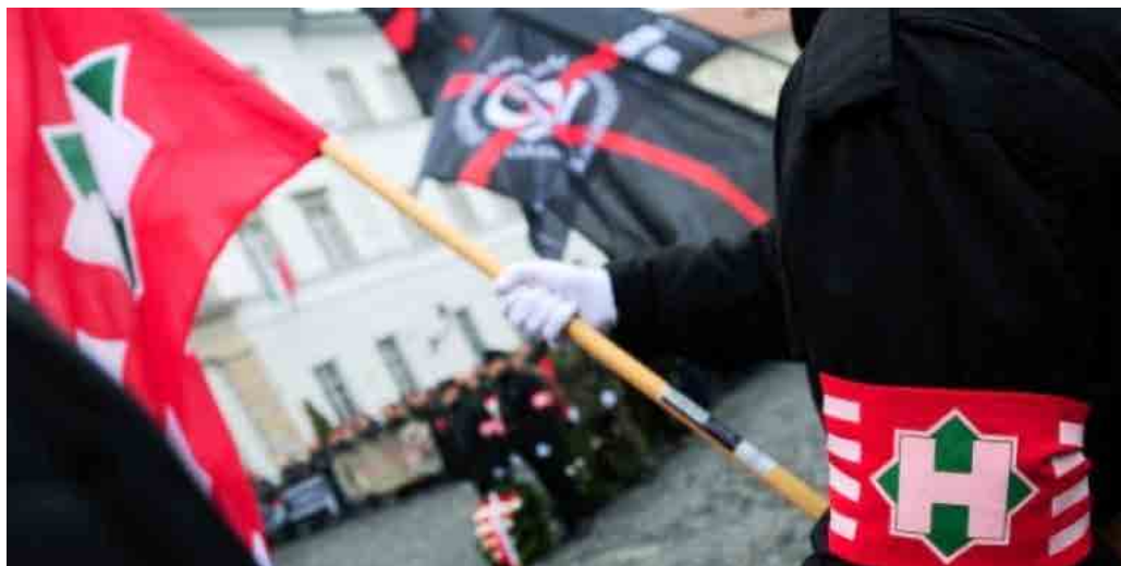
Угорська неонацистська організація «Рух національний фронт»

Найбільш помітною особливістю співпраці Кремля та словацьких праворадикальних парамілітарних угруповань є активний рекрутинг місцевих «пасіонаріїв» для подальшого залучення до терористичної діяльності на Донбасі у складі збройних формувань сепаратистів