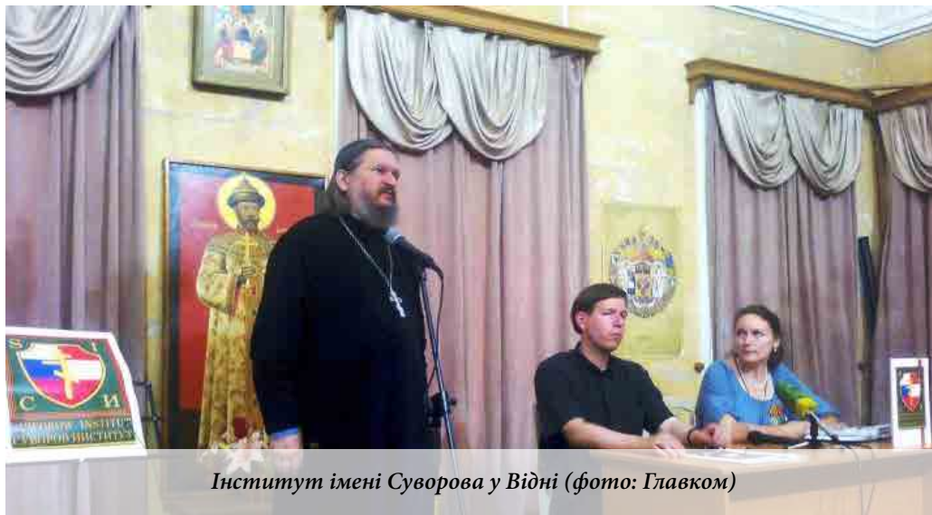
Інститут імені Суворова у Відні

схожому фарватері діє Центр континентального співробітництва (Center for Continental Cooperation), джерела фінансування якого частково знаходяться в Росії. При цьому обидві організації мають тісні зв'язки з Ідентитариським рухом в Австрії.