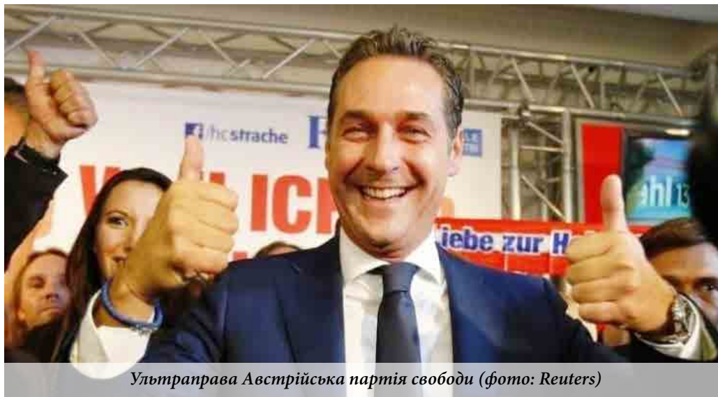
Ультраправа Австрійська партія свободи

З огляду на ворожий до України дискурс, у межах якого діє АПС, цілком предметне занепокоєння викликає зростання підтримки партії серед австрійських виборців напе-